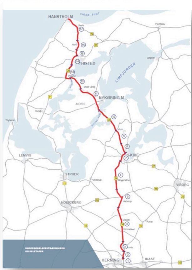
FIGUR 1: HERNING-HANSTHOLM